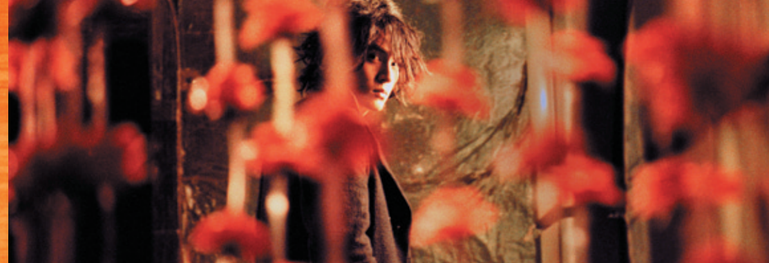
CARINA LAU KA LING

Ayant fait ses classes dans de nombreuses séries télévisées, Carina Lau est apparue comme l’une des plus constantes et étonnantes actrices de Hong Kong. Sa prestation majeure dans Nos Années sauvages ( Days of Being Wild ) de Wong Kar Wai a révélé l’étendue de son talent, et lui a valu le prix de la meilleure actrice au Festival des 3 Continents de Nantes. Elle a également été remarquable dans Les Cendres du temps ( Ashes of Time ) de Wong Kar Wai. Elle apparaît régulièrement dans de nombreux films chinois et a récemment été à nouveau nommée, dans la catégorie meilleure actrice, aux Film Academy Awards de Hong Kong pour son rôle dans Infernal Affairs 2 .