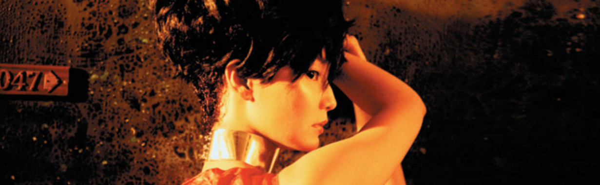
MAGGIE CHEUNG MAN YUK

Maggie Cheung s’est progressivement fait connaître grâce à des rôles marquants. Elle s’est imposée dans Police Story de Jackie Chan, et a renforcé sa notoriété avec son étonnante performance dans la première réalisation de Wong Kar Wai, As Tears Go By . Depuis, elle a fait des apparitions mémorables dans des films de Wong Kar Wai - Nos Années sauvages ( Days of Being Wild ) et Les Cendres du temps ( Ashes of Time ) -, de Clarence Fok - The Iceman Cometh -, de Johnnie To - The Heroic Trio -, et dans Le Chant de l’exil ( The Song of the Exile ) de Ann Hui. Elle est la première actrice chinoise à remporter un Ours d’argent au Festival de Berlin, grâce à sa prestation de la légendaire diva tragique Ruan Lingyu, dans Centre Stage de Stanley Kwan. Elle a partagé l’affiche avec Tony Leung dans In the Mood for Love de Wong Kar Wai et dans Hero de Zhang Yimou. Son premier film non chinois fut Irma Vep , du réalisateur français Olivier Assayas.